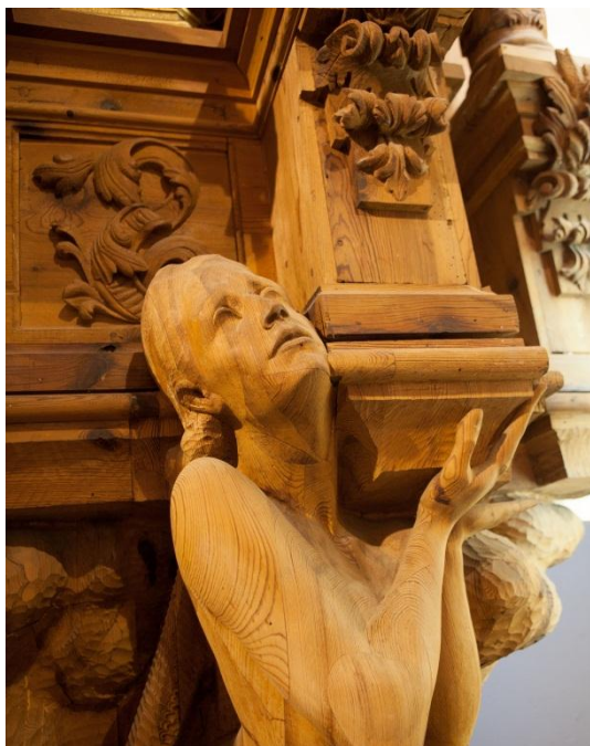
Eva, detalle retablo ermita de Motilla

Estos dos trabajos llevaron a la Junta Administrativa de la Virgen a encargarle el proyecto del retablo. Fue con un fragmento de este proyecto que presentó en la Exposición Provincial de la Organización de Educación y Descanso donde obtuvo el Primer Premio de talla de ornamentación en madera .