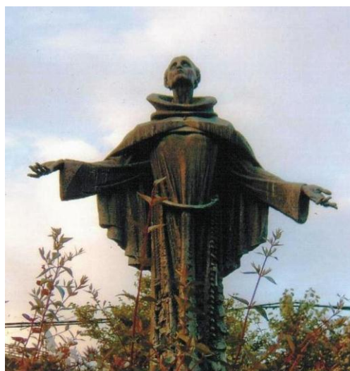
San Pedro de Alcántara Arenas de San Pedro, Ávila