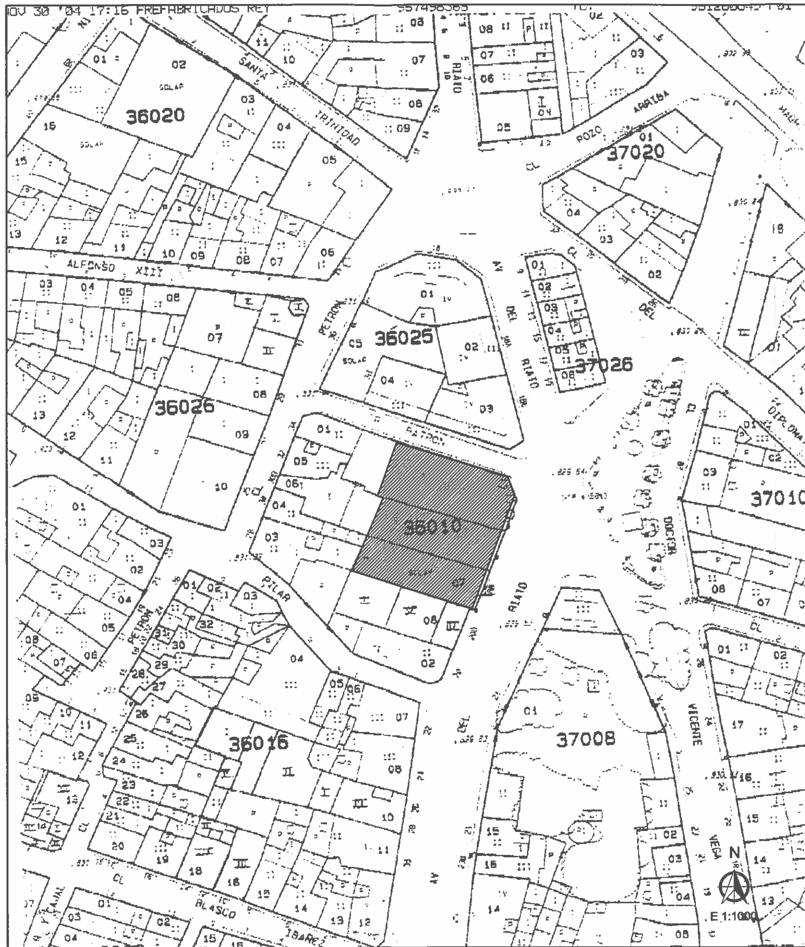
PLANO DE SITUACIÓN E: 1/1000